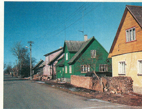
Kolkja külas asub Peipsiääre valla keskus.