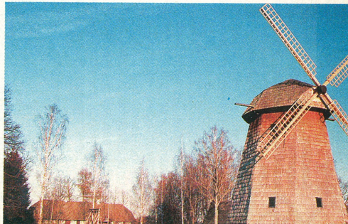
Karilatsis paikneb Lõuna-Eesti suurim vabaõhumuuseum.