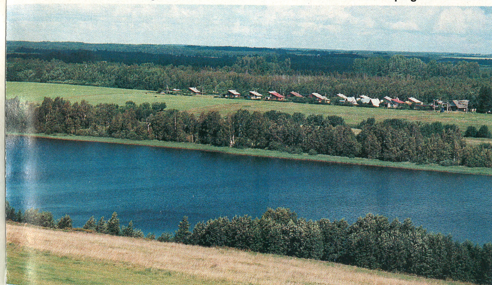
Raigastvere tornist avaneb ilus vaade Vooremaa maastikule.