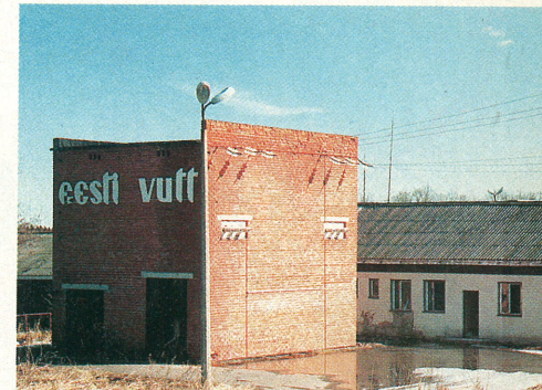
Kaiavere vutikasvatus seisab mahajäetuna.