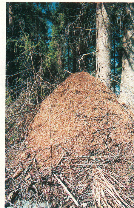
Alatskivi-Padakõrve kaitsealal paikneb üks Eesti suuremaid sipelgakolooniaid.