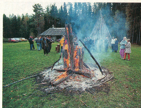
Retke teine laagripaik – Riidma talu.