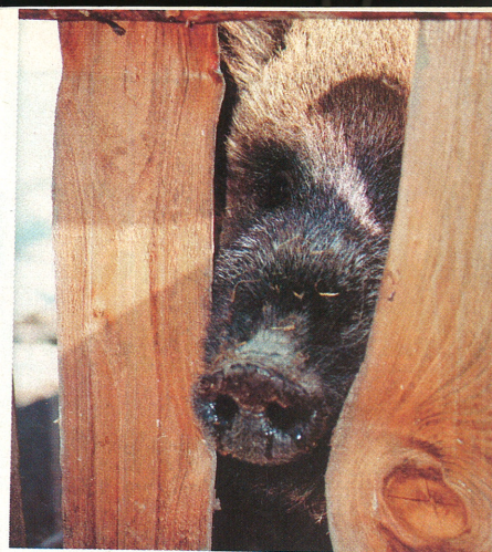
Metsiga Maša on laste suur lemmik.

Perenaise sõnul on ilvesed sedavõrd varjatud eluviisiga, et alates möödunud märtsikuust, kui ilvesed Elistverre elama asusid, on ta vaid ühe korra näinud, kuidas ilves puu otsa ronib. Mitmed piltnikud on tundide ja päevade viisi valvel olnud, et haruldast toimingut jäädvustada, ent siiani pole see veel kellelgi õnnestunud.