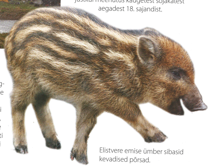
Elistvere emise ümber sibasid kevadised porsad.

Telklaagri ja Laiuse linnuse vahele jäi ojake, justkui meenus kaugetest sõjakatest aegadest 18. sajandist.