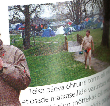
Teise päeva õhtune torm oli osade matkasellide varustus täiesti läbi ning mõttekas oli küürimiseks end juba päris paigale.