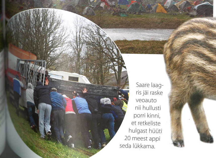
Saare laagris jäi raske veoauto nii hullusti porri kinni, et retkeliste hulgast hüüti 20 meest appi seda lükkama.